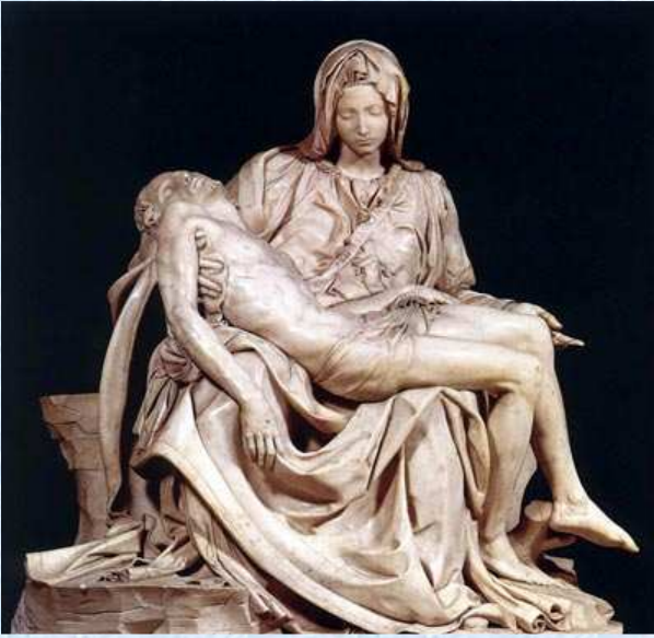
La Pietà di Michelangelo Buonarroti

“Assai acquista chi perdendo impara” Michelangelo Buonarroti